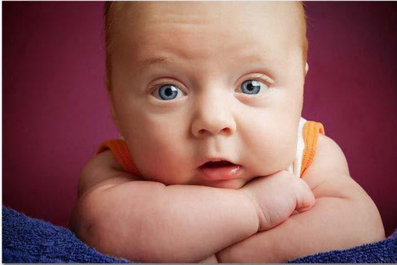
by Adrian Adrianus